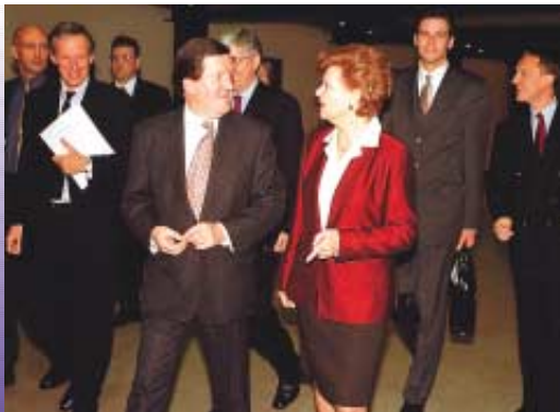
Генеральный секретарь НАТО лорд Дж. Робертсон приветствует президента Латвии В.Вике-Фрейбергу в Брюсселе 26 октября 1999

Например, еще в феврале 2001 года канцлер Австрии Вольфганг Шюссель заявил, что Австрия фактически уже не является нейтральной, потому что ее присоединение к ЕС в 1995 году повлекло за собой и определенные обязательства в сфере безопасности. Шюссель определил свою страну как «не нейтральную, но неприсоединившуюся» — пока. Четыре дня спустя, принимая в Вене Владимира Путина, президент Австрии Томас Клестиль объяснил, что реального отличия между странами, которые входят и в ЕС, и в НАТО, и теми, кто входят только в ЕС, нет. «Дело в том, что ЕС будет зависеть от ресурсов и опыта НАТО, особенно при проведении сложных антикризисных операций». (Российский президент, отвечая на вопрос о возможном официальном отказе Австрии от конституционного нейтралитета, сказал: «Это выбор, который австрийцы должны сделать сами».) (Цитируется по Agence France Presse, Feb 8, 2001, dateline: VIENNA.)