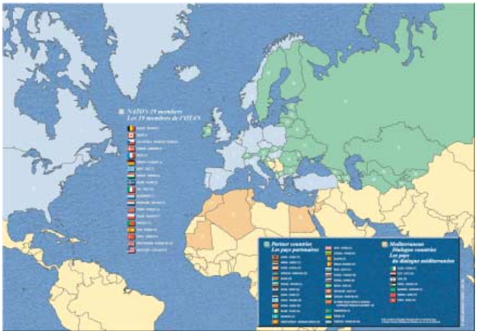
Зона, в которой действуют союзнические обязательства НАТО.

«...территория любой из Договаривающихся сторон в Европе или Северной Америке, территория Турции или острова, расположенные в Североатлантической зоне севернее Тропика Рака и находящиеся под юрисдикцией какой-либо из Договаривающихся сторон; вооруженные силы, суда или летательные аппараты какой-либо из Договаривающихся сторон, если эти вооруженные силы, суда или летательные аппараты находились на этих территориях, или над ними, или в другом районе Европы, или над ним, если на них или в нем на момент вступления в силу настоящего Договора размещались оккупационные силы какой-либо из Договаривающихся сторон, или в Средиземном море, или над ним, или в Североатлантической зоне севернее Тропика Рака, или над ней». Из Статьи 6 Североатлантического (Вашингтонского) договора