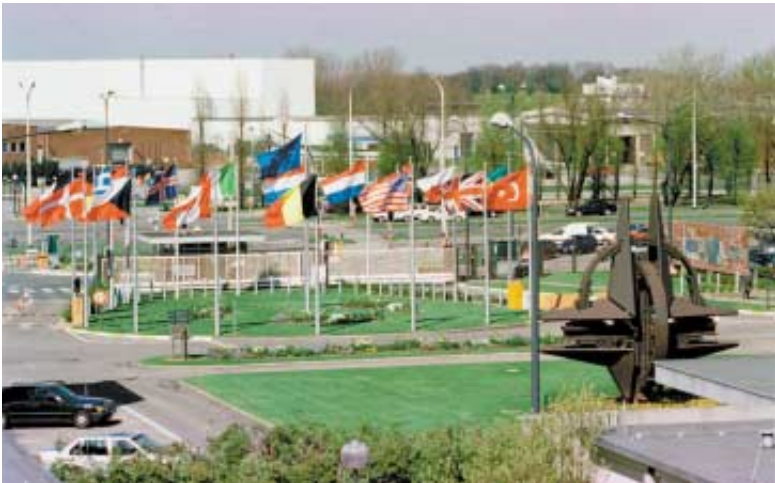
Генеральный штаб НАТО, Брюссель.

Сегодня аналитики пишут, что НАТО, в которое вступят страны–кандидаты, будет совсем не таким, каким она была 9–10 лет назад. За это время организация обросла мифами и стереотипами. Чтобы иметь представление о том, куда ведут приоритеты внешней политики Латвии, давайте выясним — как НАТО изменилось и каким НАТО никогда не было.