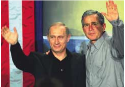
Президенты Буш и Вл. Путин приветствуют студентов Высшей Крауфордской школы, Техас, 15 ноября 2001 года

Особенно актуально сотрудничество между державами именно сейчас, когда человечеству угрожает терроризм, когда войны сменили этнические, религиозные, экономические кризисы.