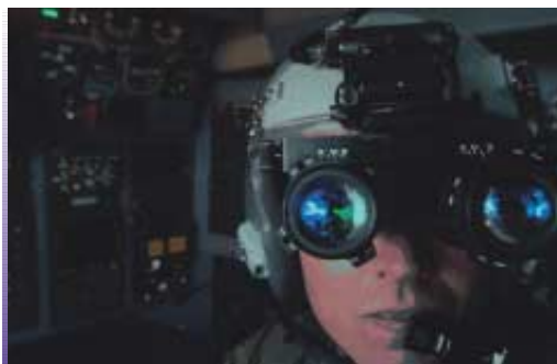
В ночные вылеты Тед Райт одевает защитные очки и в них он видит так же хорошо, как днем

Общая тенденция альянса — профессионализация вооруженных сил. Это значит больше военного мастерства, знаний в военной тактике, больше современной военной техники и меньше людей.